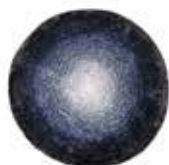
8 DIBBETS RAINBOW "ARCTIC" TAPPETO Ø CM 500