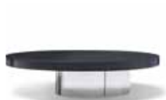
4 RAYMOND TAVOLINO CM 180X180 H29