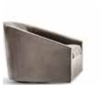
3 QUINN POLTRONA CM 78X95 H70